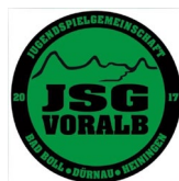
JSG Voralb [Deutschland]